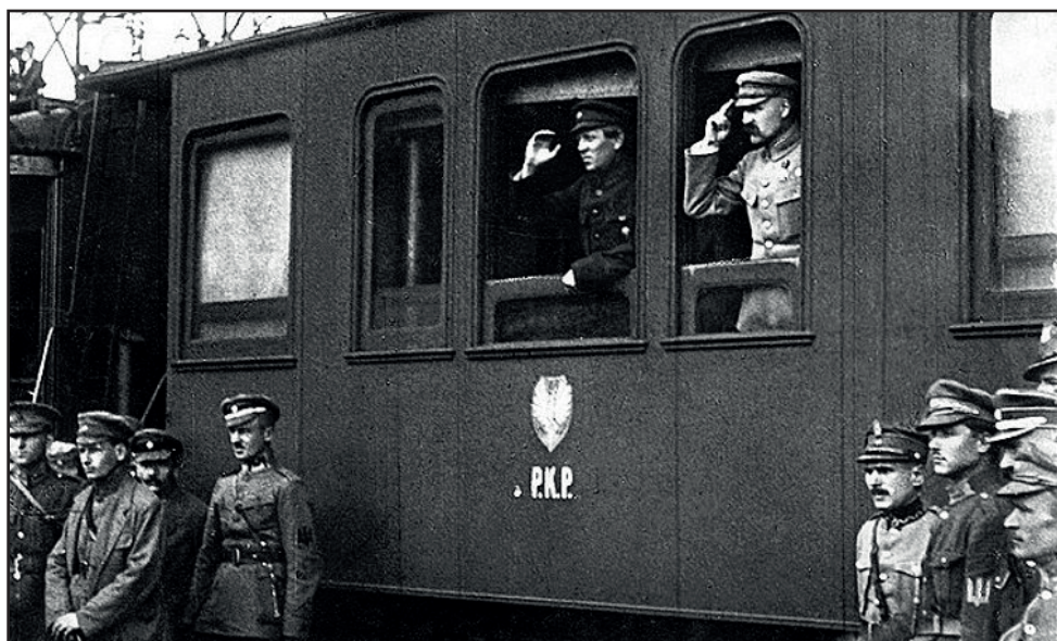
Szimon Petljura és Józef Piłsudski 1920 áprilisában, Winnicában.

A bolsevikok kicselezték a lengyeleket, és 1920. május 14-én Belaruszban támadásba lendültek. Az oda átdobott lengyel tartalékok ugyan feltartóztatták őket, de június 5-én Szemjon Bugyonnij 1. lovashadserege Kijevtől délre áttörte a frontvonalat, és a lengyel hadsereg hátába került. Ebben a helyzetben Rydz-Śmigly tábornok parancsot adott Kijev kiürítésére, és nyugat felé vonult vissza. Hadseregét ugyan megmentette, de nem hajtotta végre Pilsudski parancsát, aki megütközött volna Bugyonnij lovasaival. A „kijevi hadjárat” így vereséggel végződött.