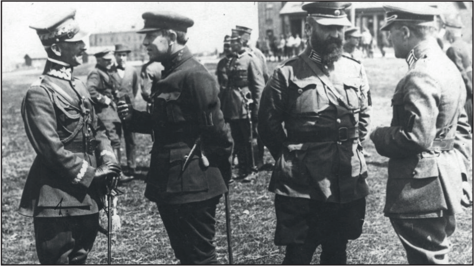
A címlapképen Antoni Listowski tábornok (balról az első) és Szimon Petljura atamán (balról a második) beszélget 1920 áprilisában.

„Bocsánat, uraim, nagyon sajnálom. Ennek nem így kellett volna történnie.”